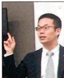
この後に社長による理念

数年後には店長になります！という頼もしい決意もありました、お客様に寄り添ってお客様の望むことをかなえられるようなショップスタップを目指します、心も身体も健康で仕事に望みたい、まったく新しい環境で安定した生活を目指しますなど7人7様の決意表明でした。