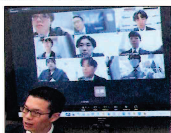
研修がリアルとオンラインでのハイブリット方式で行われました。

新社員の皆さんは、これから覚えることが山のようにあると思います。皆さんひとりひとりの力が、当社が目指す携帯電話業界におけるリーディングカンパニーとなる目標を達成するためには、絶対に必要です！頑張ってください！「日々精進」です！