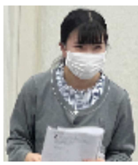
おめでとうございます。翌月には、茨城でも会場を借りて「ハートフル研修」を行いました。