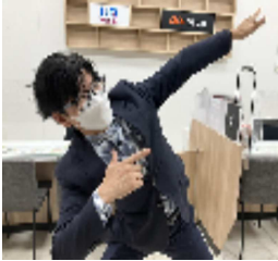
会場はつくばでしたが、遠いところ事故もなく無事に終了しました。茨城のMVPは、東海金の

さんでした。今までの画像が迂闊にも撮れませんでしたので、後日店舗での撮影になりました。MVP受賞の喜びを見事に身体で表現していただきました、おめでとうございました