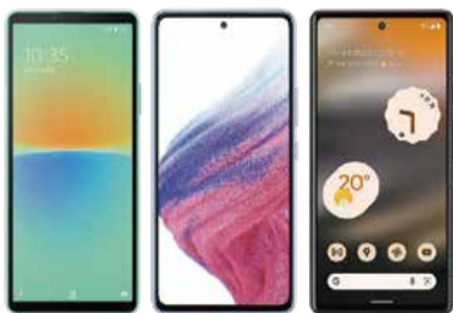
Xperia 10 IV Galaxy A53 5G Google Pixel 6a