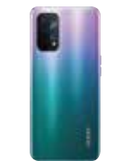
ファンタスティック パープル