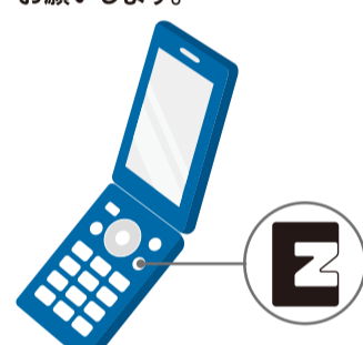
「EZ」マークがついている

その他対象機種はauホームページで確認できます。 ご不明な場合は当店までお問い合わせください。