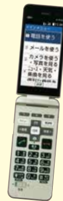
かんたんケータイライト