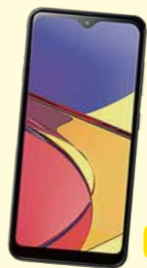
Galaxy A21 シンプル