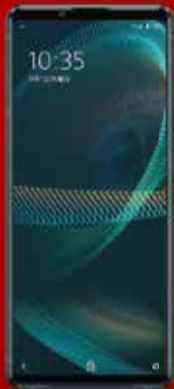
XPERIA 5 III SOG05