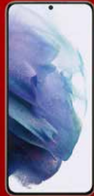
Galaxy S21+ 5G SCG10