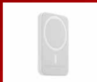
MagSafeバッテリーパック