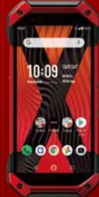
TORQUE 5G KYG01