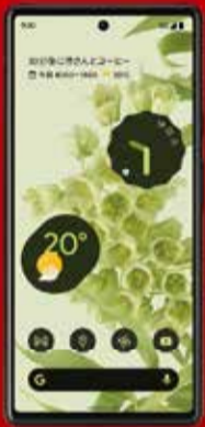
Google Pixel 6