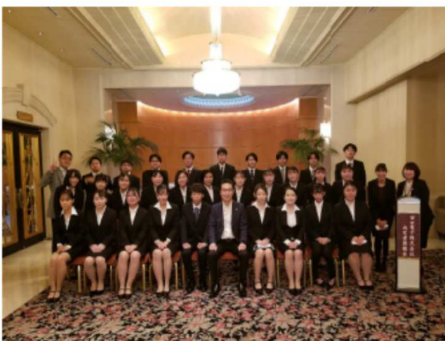
全員での集合写真です

緊張の中、内定式が始まりました。社長から内定者の皆さんへ挨拶です。田中電子から新社会人としてスタートする皆さんとの出会いを大切にして、仕事を通じて皆さんが人として成長することを応援していく思いが込められています。そして内定者の皆さんがひとりづつ自己紹介をしていきました。ちょっと前までは、内定式といったらアルコールで乾杯というイメージでしたが、このコロナ禍においてはそれが難しいですね。そこで、当社ではお茶とスイーツのアフタヌーンティーという場になりました。ちょっと気取ってアフタヌーンティーの歓談でしたが、とても健全な懇親会だと感じました。